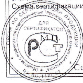
Схема сертификации 7.

Место нанесения знака соответствия – в товаросопроводительной документации, графическое изображение знака соответствия по ГОСТ Р 50460-92 с надписью «Добровольная сертификация».