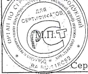
Схема сертификации 7.

Место нанесения знака соответствия – в товаросопроводительной документации, графическое изображение знака соответствия по ГОСТ Р 50460-92 с надписью «Добровольная сертификация»